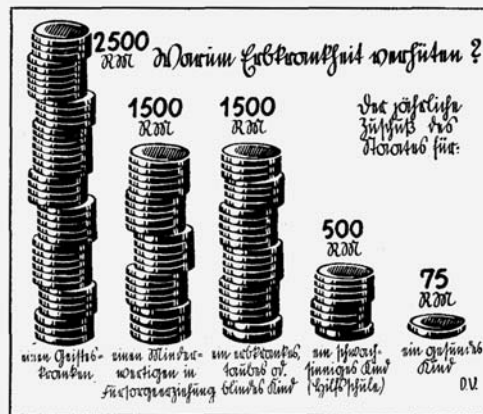
Heye/Lietzmann: Mathematisches Unterrichtswerk für höhere Schulen, Teubner 1939

19. Ausgaben für Erbfranke. Gib an, wieviel Prozent des Betrages, den der Staat für ein gefundes Kind jährlich verausgabt, für die einzelnen im Bilde (Abb. 97) angegebenen erblich belafteten Kinder aufzuwenden sind!